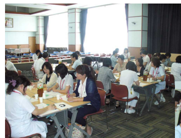
▲ 活発な意見交換がされたグループディスカッションの様子 ▶

「介護現場における知っておきたい糖尿病の基礎知識」!! 高齢者糖尿病の実態・特徴・治療法・注意点についての解説後、事前アンケートでの質問に対しQ & A形式で回答! 皆さん真剣なまなざしです…。