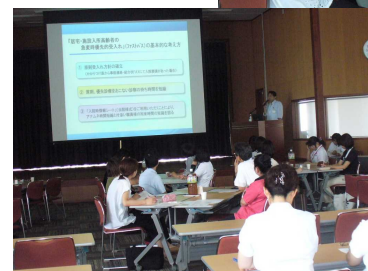
▲ 当院の『高齢者急性期受入れパス』の説明