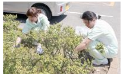
院外清掃(CS向上委員会)