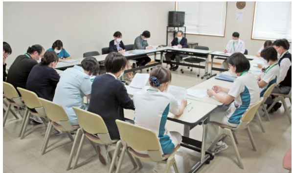
リスクマネジメント委員会