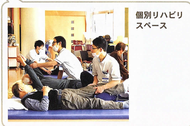
個別リハビリスペース