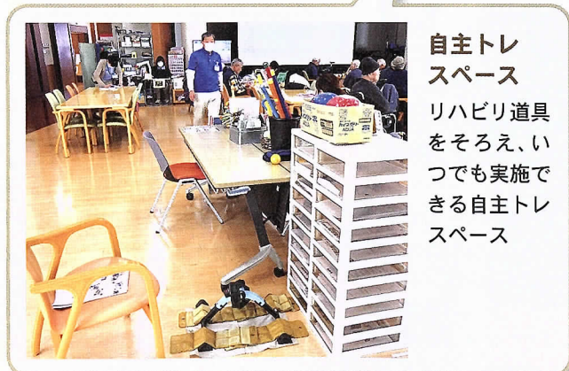
自主トレスペース リハビリ道具をそろえ、いつでも実施できる自主トレスペース