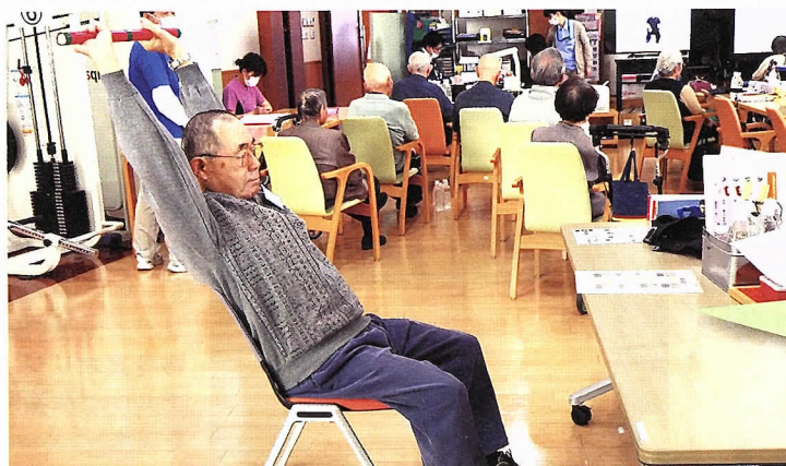
新聞棒など身近な材料を使ってできる自主トレを多数用意している