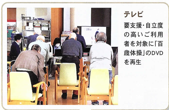
テレビ 要支援・自立度の高いご利用者を対象に「百歳体操」のDVDを再生

映像を見ながら自主的に行える体操と、リハビリ専門職が直接指導する小集団リハビリを行うことで、リハビリ専門職の負担を減らしながら効率的・効果的にリハビリを行うことができます。