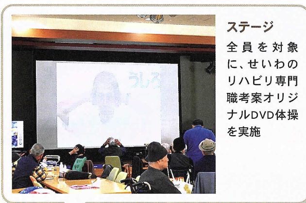
ステージ 全員を対象に、せいわのリハビリ専門職考案オリジナルDVD体操を実施